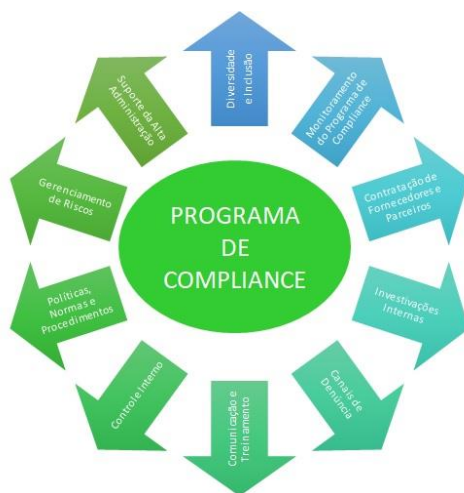
Figura 2 - Programa de Compliance