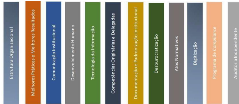
Figura 1: Eixos Estratégicos do Ambiente de Controle: